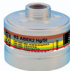
Kombinationsfilter 93 ABEK2-Hg/St