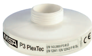
Partikelfilter P3 PlexTec