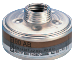
Gasfilter 90 AB